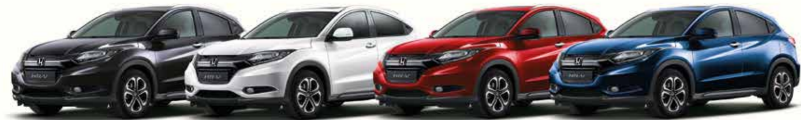
Ruse Black Metallic