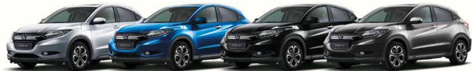
Alabaster Silver Metallic